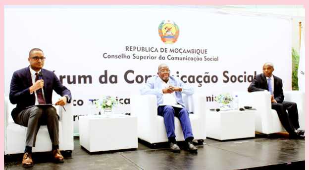
Quelques panelistes ayant animé le forum.

assistent, nous soutiennent dans cet immense tâche qui est l'édification d'un l'État de droit démocratique, à travers l'objectivation de la pluralité des médias, configurée comme un pilier essentiel de la démocratie.