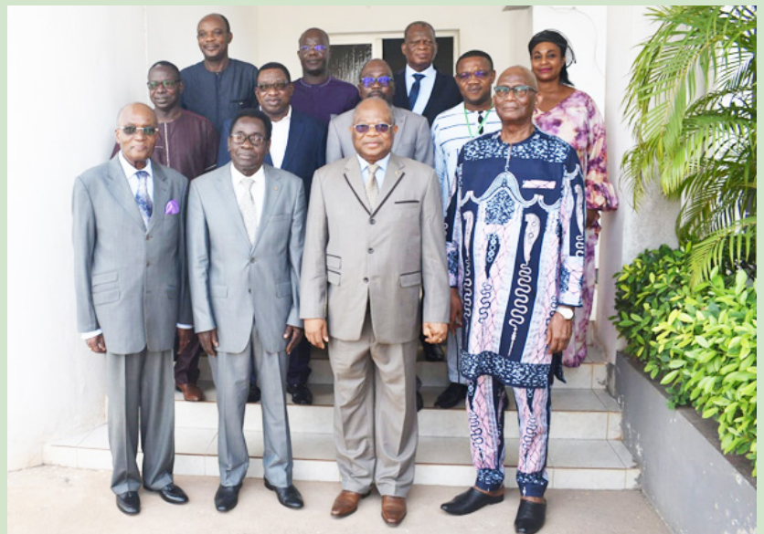
Photo de famille délégation CENI - membres de la HAAC

nous sommes obligés de nous retrouver et de faire ensemble une programmation pour le bon déroulement médiatique des élections. La CENI a l'expertise de la comptabilité mais la HAAC a l'expertise de la communication,