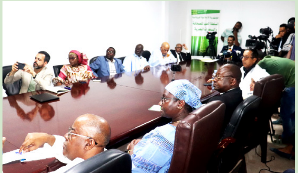
Vue partielle des participants

utilisé leur part d'annonces dans les deux journaux.