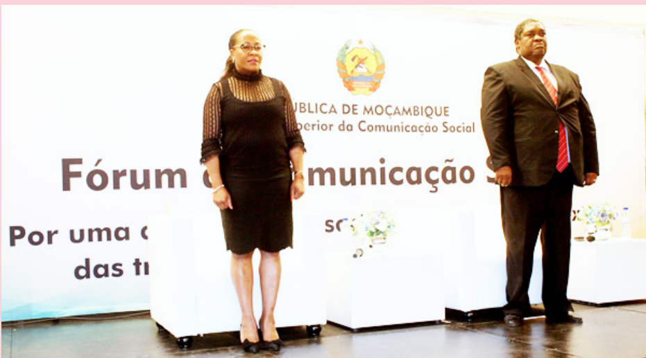
De gauche à droite, Dr. Helena Mateus Kida, Ministre de la Justice, des Affaires Constitutionnelles et Religieuses à l'ouverture des travaux du forum.

Excellence Filipe Jacinto Nyusi, Président de la République du Mozambique, était un grand honneur. Le Président a rappelé que les Conseillers du CSCS, lorsqu'ils ont pris leurs nobles fonctions en mai 2021, les premiers débats ont gravité, de manière consensuelle, autour de l'impératif de réunir dans un même espace, les professionnels de la Communication, d'une part, et d'autre part, en ajoutant à ceux-ci, leur famille élargie, à savoir les entités gouvernementales, les universitaires, les partenaires stratégiques et les organisations de la société civile ayant un intérêt pour les médias. Le Forum visait à répondre à deux objectifs : procéder à une introspection sur la scène de la communication, tout en sollicitant les apports de ceux qui nous lisent, nous écoutent, nous