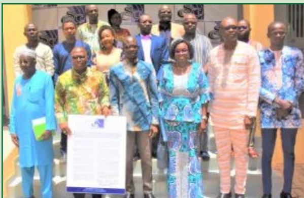
Un cadre du CSC, exposant sur les dix conseils

Pour lui, la diversité des acteurs de cette initiative permettra la promotion d'une utilisation saine, responsable et citoyenne des réseaux sociaux dans notre pays.