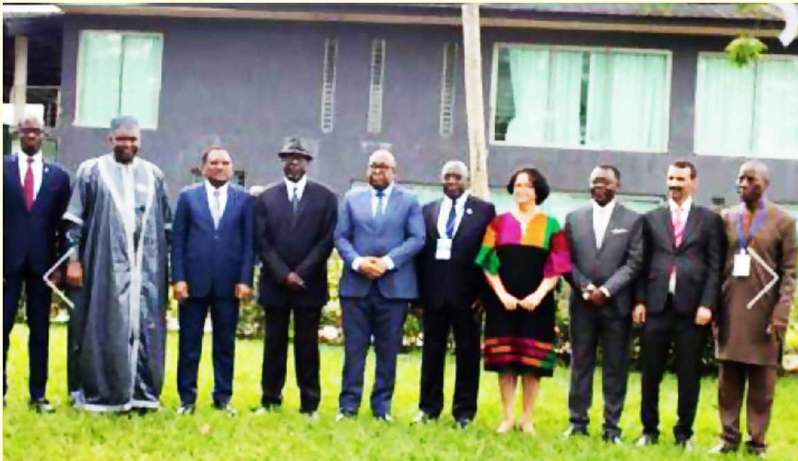
Photo de famille des Présidents ayant pris part au colloque