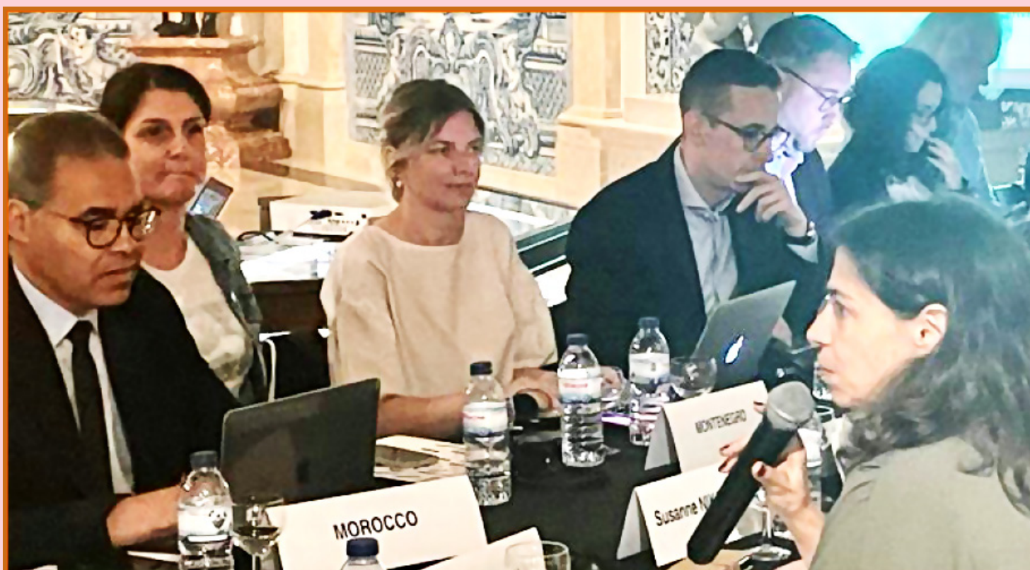
Vue partielle des participants à la réunion

A titre de rappel, la HACA avait été admise, en 2013,