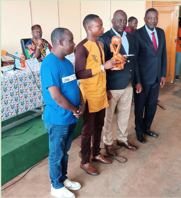
Vue remise du prix OLOFIO au représentant de la Radio BARANGBAKE

Les organisations professionnelles des médias, les journalistes et les étudiants du Département des sciences de l'information et de la communication (DSIC) ont célébré dans l'allégresse la journée mondiale de la liberté de la presse, à l'instar des hommes et femmes des médias du monde entier. Deux événements ont marqué cette journée : Conférence/débat suivi de la porte ouverte du département des sciences de l'information et de la communication qui a célébré ses 15 ans d'existence.