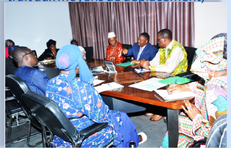
Vue partielle des participants lors de la séance de travail (en face à l'extrême gauche, le Président de la HAC Guinée).