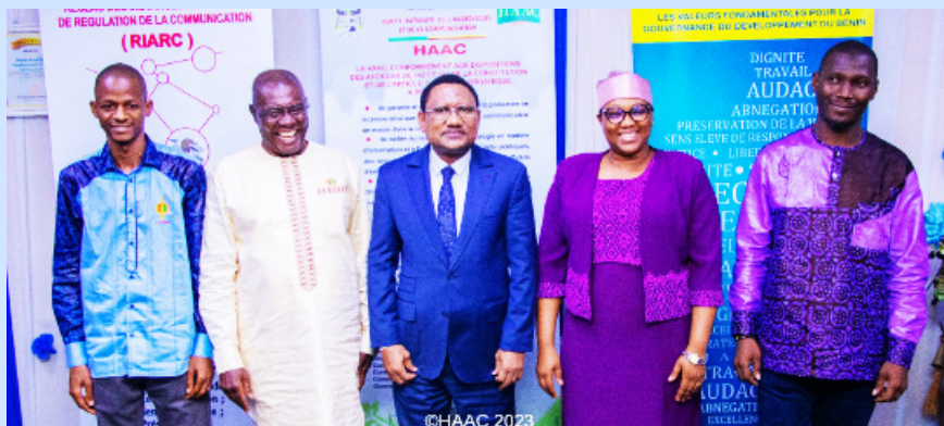
Les Conseillers de la HAAC en séance avec la délégation de l'ATPB.