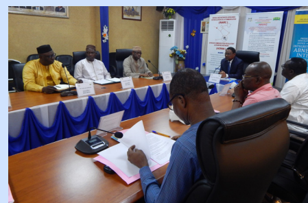
Séance de travail avec la délégation de la HAC du Mali et le Président de la HAAC et les Conseillers.